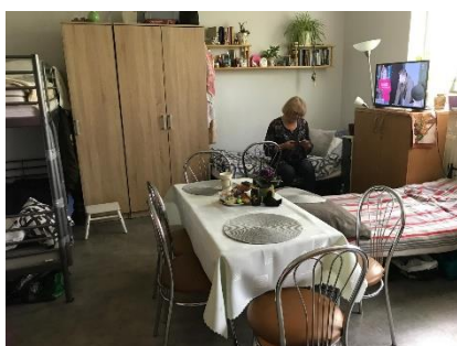
Kamer waar 7 vrouwen wonen