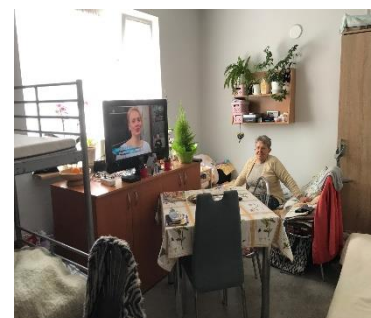
Ieder zijn eigen hoekje....