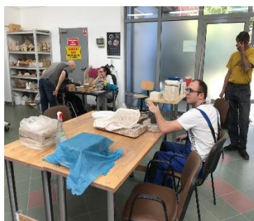
Sociale werkplaats Celestyn